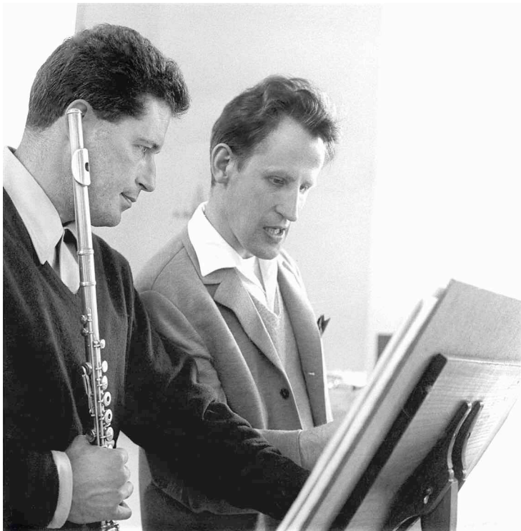
Aurèle Nicolet und Klaus Huber, ca. 1968